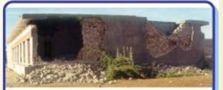
(क) एक मोटी दीवार का दो परतों में बंटना

भूकंप द्वारा हुई क्षति के मुख्य प्रतिरूपों (पैटर्नों) में शामिल हैं : (क) उभरना/क्षैतिज दिशा में दीवारों का दो भिन्न परतों यानी वाइथेस में अलग होना (चित्र 2 क), (ख) कोनों तथा टी-संधियों पर दीवारों का अलग होना (चित्र 2 ख), (ग) खराब तरह से निर्मित छत का दीवारों से अलग होकर अंततः ध्वस्त हो जाना और (घ) दीवारों का विघटन तथा संपूर्ण वास का ध्वस्त हो जाना।