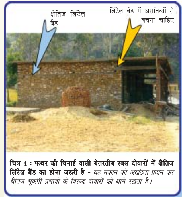
चित्र 4 : पत्थर की चिनाई वाली बेतरतीब रबल दीवारों में क्षैतिज लिटेल बैंड का होना जरूरी है - यह मकान को अखंडता प्रदान कर क्षैतिज भूकंपी प्रभावों के विरुद्ध दीवारों को थामे रखता है।

हालांकि इस किस्म के पत्थर की चिनाई वाले निर्माण में भूकंप प्रतिरोध की दृष्टि से कमी होती है लेकिन परंपरा तथा कम लागत के कारण इसका व्यापक तौर पर इस्तेमाल संभवतया आगे भी जारी रहेगा। लेकिन भविष्य में आने वाले भूकंपों के दौरान इंसानी जान एवं माल की हिफाजत के लिए यह जरूरी है कि ऊपर वर्णित पत्थर की चिनाई के सही निर्माण (खासकर भूकंपी क्षेत्र III तथा अधिक के लिए (क) तथा (ख) में वर्णित लक्षणों) को अपनाया जाए। इसके अलावा भूकंपी बैंडों के प्रयोग की भी गहन संस्तुति की जाती है (जैसा कि ऊपर के लक्षण (ग) तथा आईआईटीके-बीएमटीपीसी भूकंप टिप-14 में वर्णित है)।