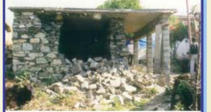
(ख) असंबद्ध बाजू की दीवारों का संधियों पर अलग होना

चित्र 2 : पत्थर निर्मित एक पारंपरिक घर की मुख्य समस्याएं - दीवारों, छत तथा उनके संबंधों में कमियां (भूकंप के विरुद्ध) उनकी विफलता के मुख्य कारण हैं।